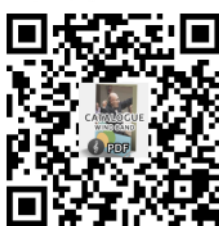
Ferrer Ferran Catalogue