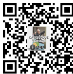
Ferrer Ferran Catalogue